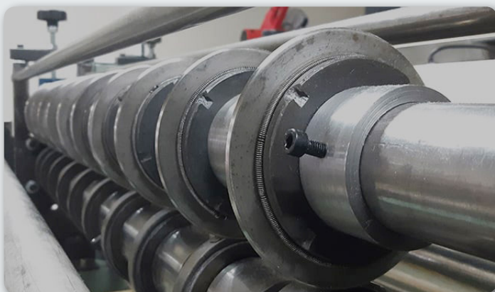
ROLL SLITTING / ЦЕПЕНЕ